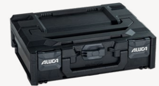
metaBox S118 Art.nr. 114871

Buitenmaten (bxdxh): 39,6 x 29,6 x 11,8 cm, binnenmaten (bxdxh): 37,9 x 26,8 x 8,3 cm, gewicht: 1,3 kg, kofferinhoud: 8,4 l, max. draagvermogen deksel: 125 kg, materiaal: ABS