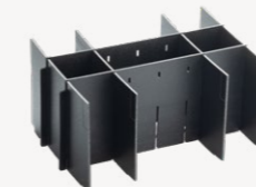
metaBox Divider S145 Art.nr. 114908