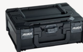
metaBox M145 Art.nr. 114877

Buitenmaten (bx dxh): 49,6 x 34,6 x 14,5 cm, binnenmaten (bx dxh): 42,9 x 31,7 x 11,0 cm, gewicht: 1,95 kg, kofferinhoud: 14,1 l, max. draagvermogen deksel: 125 kg, materiaal: ABS