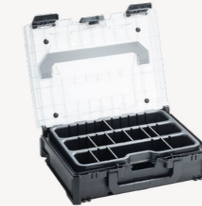
metaBox Assorter S118 Art.nr. 114901