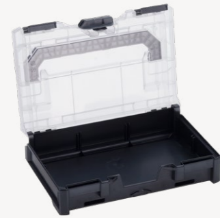
metaBox XS63 Art.nr. 114870

Buitenmaten (bxdxh): 25,2 x 16,7 x 6,3 cm, binnenmaten: 23,7 x 16,7 x 6,3 cm, gewicht: 0,4 kg, materiaal: ABS