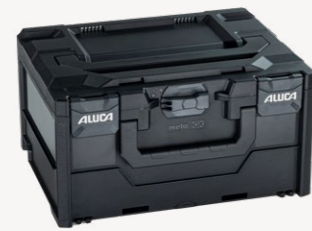
metaBox S215 Art.nr. 114874

Buitenmaten (bx dxh): 39,6 x 29,6 x 21,5 cm, binnenmaten (bx dxh): 37,9 x 26,8 x 18,0 cm, gewicht: 1,92 kg, kofferinhoud: 18,3 l, max. draagvermogen deksel: 125 kg, materiaal: ABS