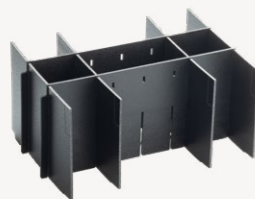
metaBox Divider S340 Art.nr. 114910