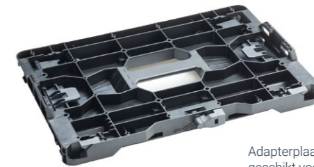
Adapterplaat metaLink geschikt voor:

Met de adapterplaat metaLink kunnen andere koffersystemen naadloos in het ALUCA-systeem worden geïntegreerd. Dankzij de speciale aansluitingen is deze adapterplaat geschikt voor het koppelen van nog zes andere merken koffersystemen: DeWalt, Festool, HiKOKI, LBox, Makita en Stanley. Het ontwerp wordt gekenmerkt door een duurzame en lichtgewicht constructie. Bovendien kan de adapterplaat ook worden gebruikt als organizer voor kleine onderdelen, ideaal voor bits en schroeven.