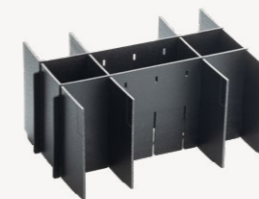
metaBox Divider M145 Art.nr. 114911