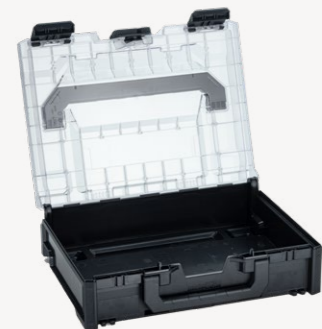
metaBox S118 Organizer Art.nr. 114872

Buitenmaten (bxdxh): 39,6 x 29,6 x 11,8 cm, binnenmaten (bxdxh): 37,9 x 26,8 x 8,3 cm, gewicht: 1,3 kg, kofferinhoud: 8,4 l, materiaal: ABS