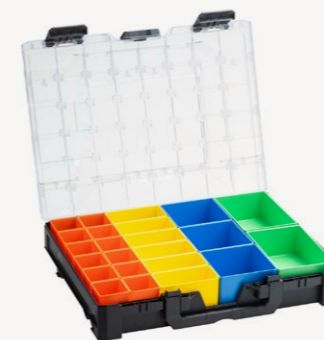
metaBox Inset Set M95

Diverse inzetbakjes zijn naar wens te rangschikken.