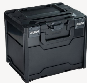
metaBox S340 Art.nr. 114875

Buitenmaten (bx dxh): 39,6 x 29,6 x 34,0 cm, binnenmaten (bx dxh): 37,9 x 26,8 x 30,5 cm, gewicht: 2,51 kg, kofferinhoud: 31,0 l, max. draagvermogen deksel: 125 kg, materiaal: ABS