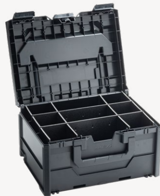
metaBox Divider S215 Art.nr. 114909