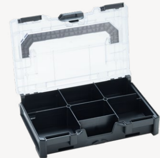
metaBox Divider XS63 Art.nr. 114924