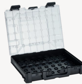
metaBox M95 Art.nr. 114876

Buitenmaten (bx dxh): 44,0 x 34,6 x 0,95 cm, binnenmaten (bx dxh): 41,7 x 31,4 x 0,58 cm, gewicht: 1,52 kg