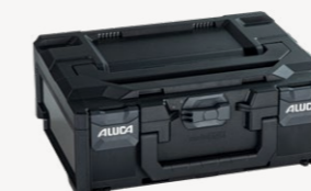
metaBox S145 Art.nr. 114873

Buitenmaten (bxdxh): 39,6 x 29,6 x 14,5 cm, binnenmaten (bxdxh): 37,9 x 26,8 x 11,0 cm, gewicht: 1,57 kg, kofferinhoud: 11,2 l, max. draagvermogen deksel: 125 kg, materiaal: ABS