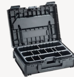
metaBox Assorter S118 Art.nr. 114901