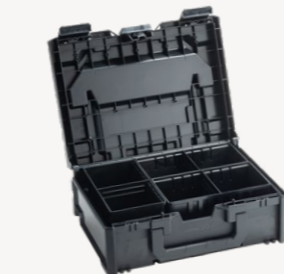
metaBox Assorter S145 Art.nr. 114903